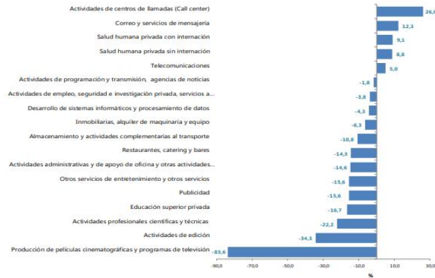
Gráfico 1. Variación anual de los ingresos nominales, según subsector de servicios Total Nacional Noviembre 2020P