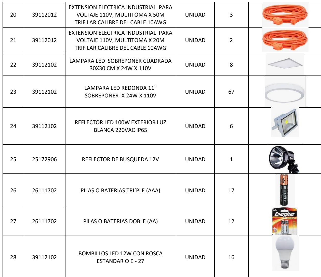
Tabla 6. Especificaciones técnicas