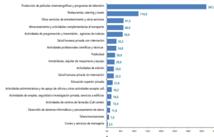
Gráfico 1. Variación anual de los ingresos nominales, según subsector de servicios Total Nacional Julio 2021*