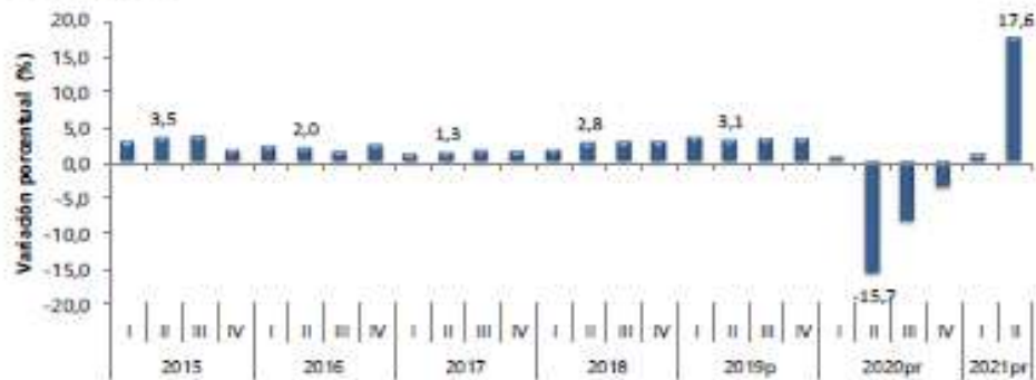
Gráfico 1. Producto Interno Bruto (PIB) Tasas de crecimiento en volumen 1 2015-I / 2021 pr -II