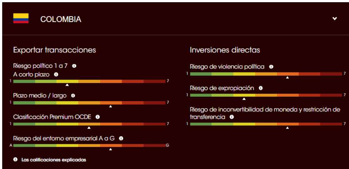
Colombia Country Risk Overview.

La siguiente gráfica presenta un resumen de la evaluación de los diferentes aspectos de Colombia que realiza la firma Credendo, una compañía europea de seguros crédito establecida en Bélgica, que ofrece a sus clientes como soporte para las decisiones de inversión en diferentes países.