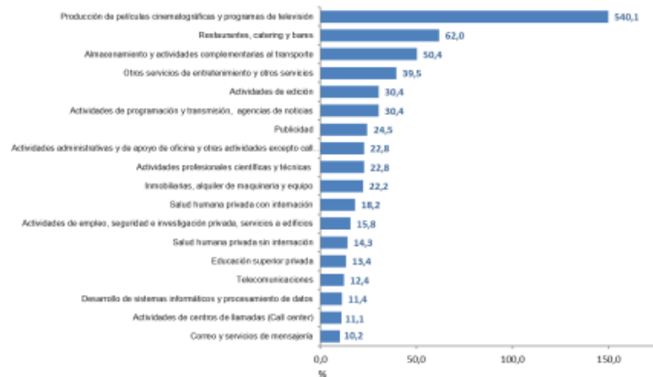
Gráfico 1. Variación anual de los ingresos nominales, según subsector de servicios Total Nacional Septiembre 2021 P