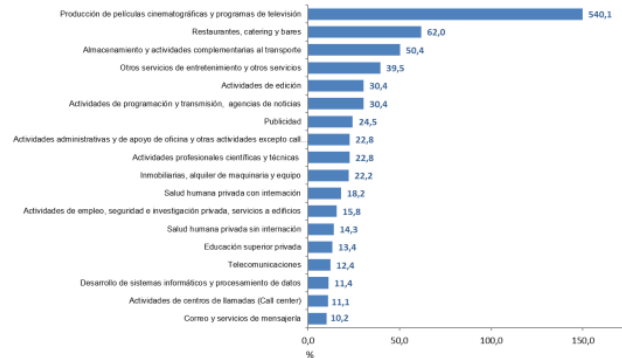
Gráfico 1. Variación anual de los ingresos nominales, según subsector de servicios Total Nacional Septiembre 2021 p