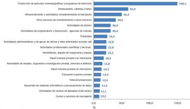
Gráfico 1. Variación anual de los ingresos nominales, según subsector de servicios Total Nacional Septiembre 2021 P