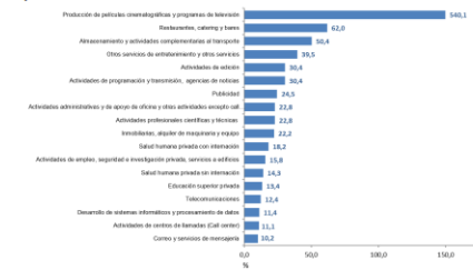
Gráfico 1. Variación anual de los ingresos nominales, según subsector de servicios Total Nacional Septiembre 2021 a