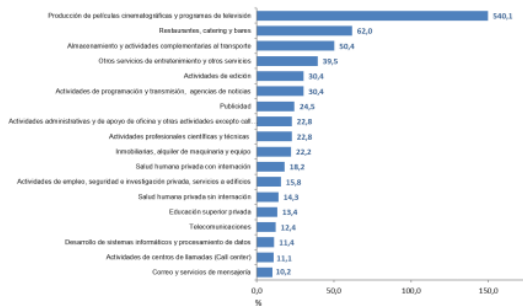
Gráfico 1. Variación anual de los ingresos nominales, según subsector de servicios Total Nacional Septiembre 2021 p