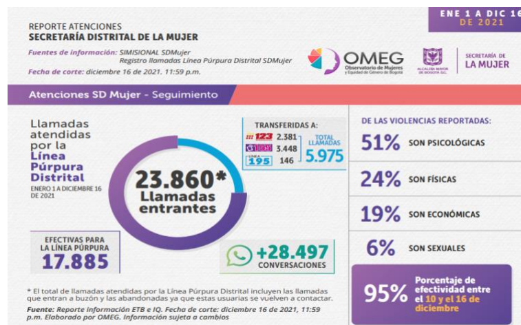
Imagen 2.

Entre el 1 de enero y el 16 de diciembre, la Línea Púrpura Distrital atendió 23.860 llamadas y entre el 23 de diciembre de 2020 y el 15 de diciembre de 2021, a través de la integración con la Línea NUSE 123, se recibieron 7.528 incidentes de violencia contra las mujeres, de los cuales 108 fueron remitidos para atención de la estrategia territorial en el marco de la integración.