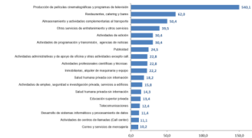
Gráfico 1. Variación anual de los ingresos nominales, según subsector de servicios Total Nacional Septiembre 2021*