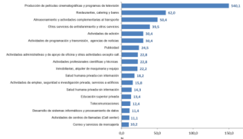
Gráfico 1. Variación anual de los ingresos nominales, según subsector de servicios Total Nacional Septiembre 2021*