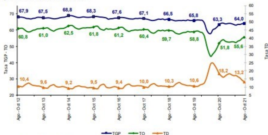
Gráfico 8. Tasa global de participación, ocupación y desempleo Total 13 ciudades y áreas metropolitanas Agosto - octubre (2012 - 2021)

que representó un aumento de 0,7 puntos porcentuales frente al mismo periodo de 2020 (63,3%). Finalmente, la tasa de ocupación se ubicó en 55,6%, lo que significó un aumento de 3,8 puntos porcentuales frente al trimestre móvil agosto - octubre de 2020 (51,8%).