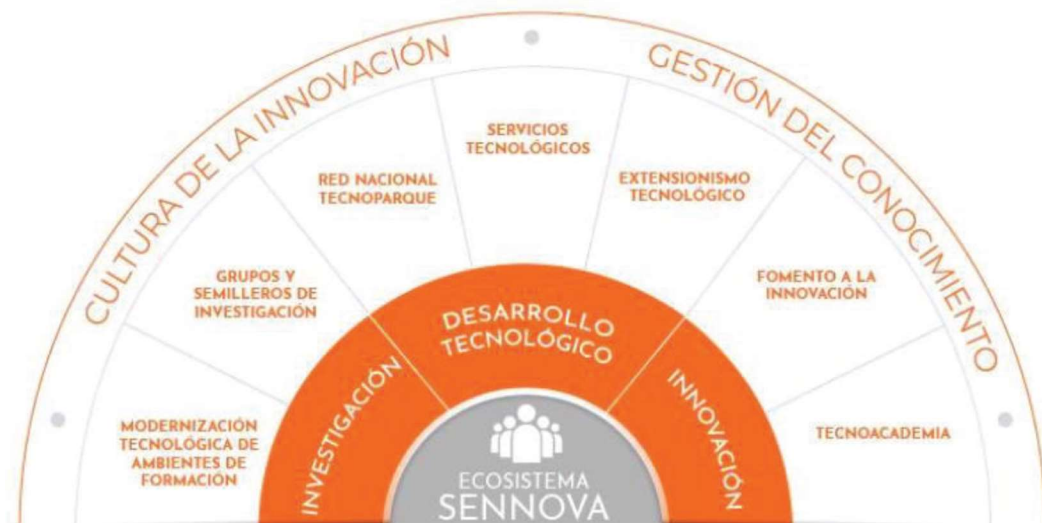
Figura 1. Ecosistema SENNOVA.

Es así, que desde la Dirección General el SENA cuenta a nivel nacional con SENNOVA, Sistema de Investigación, Innovación y Desarrollo Tecnológico, para promocionar y apoyar la generación y la transferencia de conocimiento desde los Centros de Formación SENA, contribuyendo a ejecutar la política de Ciencia y Tecnología del País. Su variedad y alcance de actuación hacen que se pueda afirmar la existencia de elementos conceptuales y operativos que responden al concepto de un auténtico Ecosistema, en el que los actores que forman parte de los diferentes grupos de interés de SENA interactúan con el objeto de reforzarse competencialmente para el desarrollo de procesos de investigación aplicada, desarrollo tecnológico e Innovación, fortaleciendo capacidades locales en productividad, competitividad, generación de conocimiento y pertinencia de la FPI impartida en la institución (Figura 1).