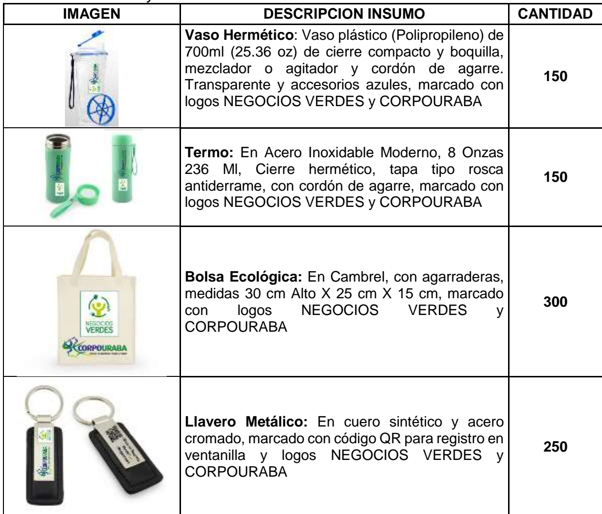
Tabla N°2 Referencia y cantidad de los insumos