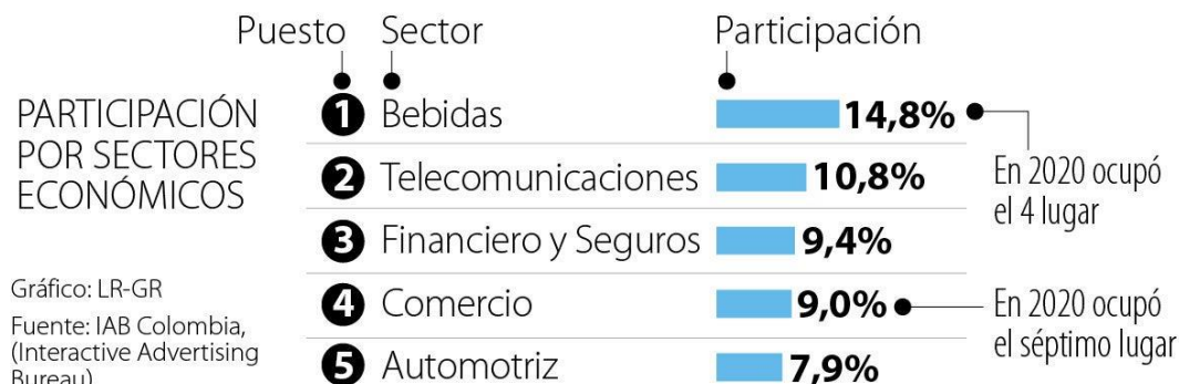
Gráfico: LR-GR