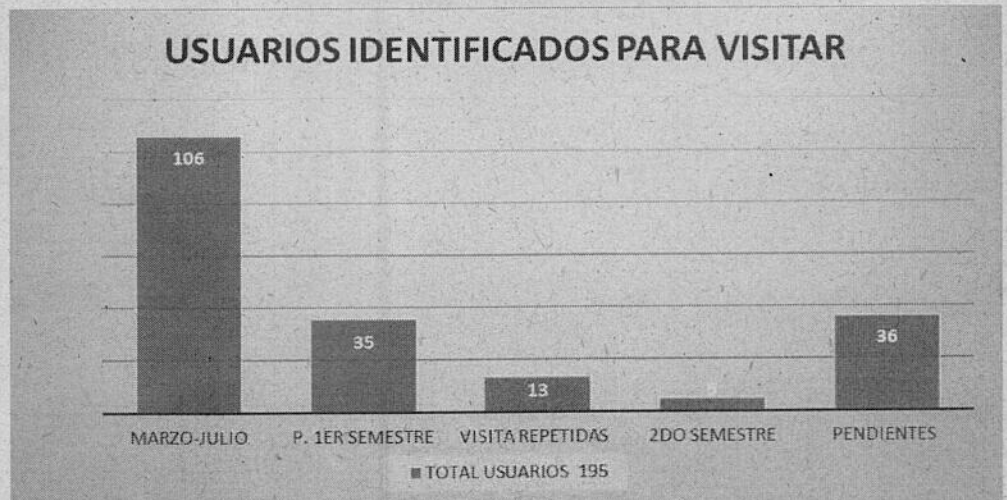
GRAFICA 3. Usuarios identificados.