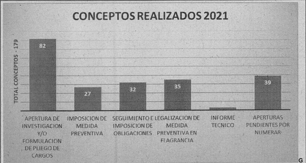
GRAFICA 4. Tipo de conceptos técnicos elaborados.