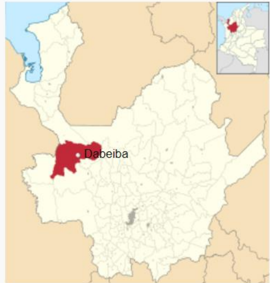
Localización de Dabeiba en Antioquia