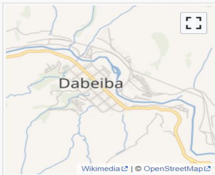
Ubicación de Dabeiba

Nit: 901457658-6 Dirección: Calle 22 # 22 - 07 San Juan de Urabá - Antioquia Teléfono: 8202100 - Celular: 3046825917 Correo: asouranor@gmail.com