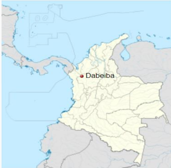
Localización de Dabeiba en Colombia

Asociación De Municipios del Urabá Norte