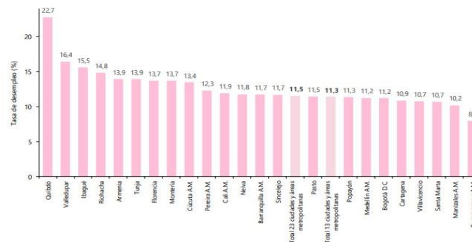
Gráfico 1. Tasa de desempleo según ciudades 23 ciudades y áreas metropolitanas Mayo- julio 2022

En el trimestre móvil mayo - julio de 2022, la tasa de desempleo de las 13 ciudades y áreas metropolitanas fue 11,3%, lo que representó una disminución de 4,5 puntos porcentuales respecto al mismo periodo de 2021 (15,8%). La tasa global de participación se ubicó en 65,2%, lo que significó un aumento de 1,5 puntos porcentuales frente al trimestre móvil mayo – julio de 2021 (63,7%). Finalmente, la tasa de ocupación fue 57,8%, lo que representó un aumento de 4,2 puntos porcentuales respecto al mismo periodo de 2021 (53,6%).