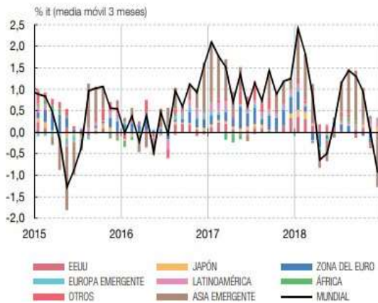
5 CRECIMIENTO DEL COMERCIO MUNDIAL. EVOLUCIÓN POR ÁREAS