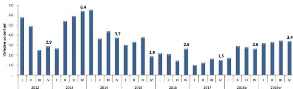
Gráfico 2. Producto Interno Bruto (PIB) Tasas de crecimiento en volumen1 2012-I – 2019pr -IV