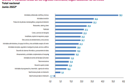
Gráfico 1. Variación anual de los ingresos nominales, según subsector de servicios