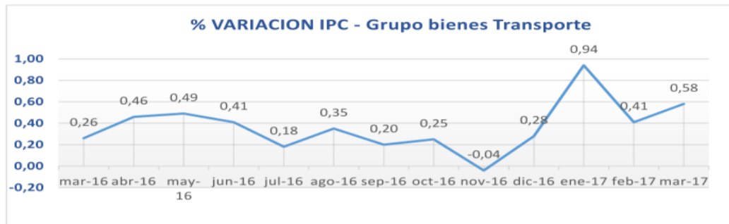
Grafica 1. Perfil IPC anual sector servicios