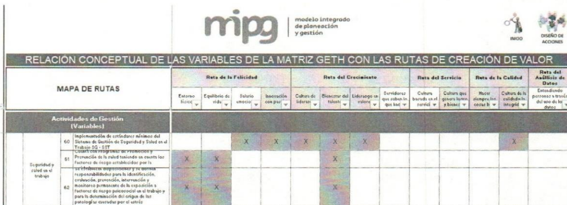
Tabla 2 Relación Conceptual de las variables con las rutas de creación de valor - Gestión Estratégica del Talento Humano – MIPG 2020