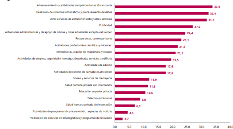
Gráfico 1. Variación anual de los ingresos nominales, según subsector de servicios Total nacional Agosto 2022 p