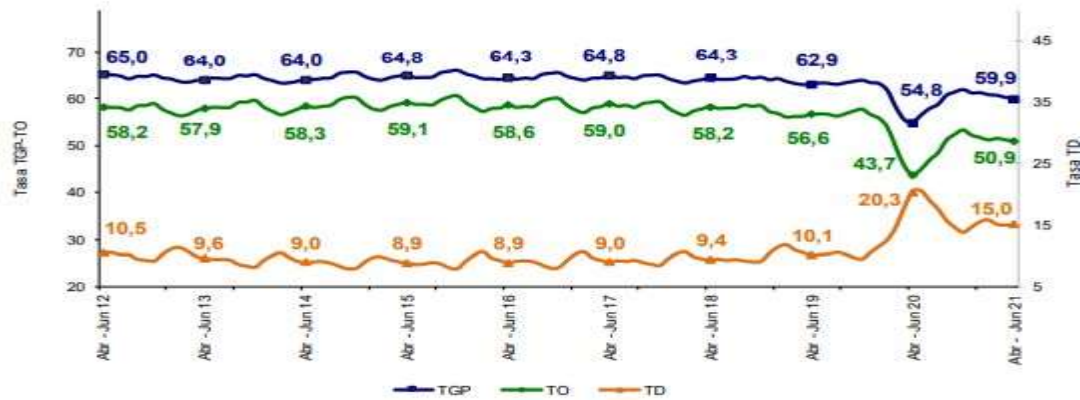
Gráfico 4. Tasa global de participación, ocupación y desempleo Total nacional Abril - junio (2012 - 2021)

periodo de 2020 (54,8%). Finalmente, la tasa de ocupación se ubicó en 50,9%, presentando un aumento de 7,2 puntos porcentuales frente al mismo trimestre de 2020 (43,7%).