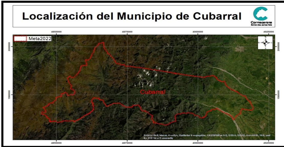
Imagen 2. Ubicación proyecto.