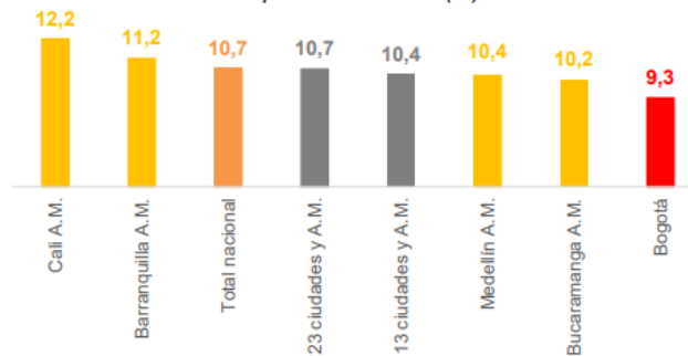
Gráfico 1 Tasa de desempleo Septiembre de 2022 (%)