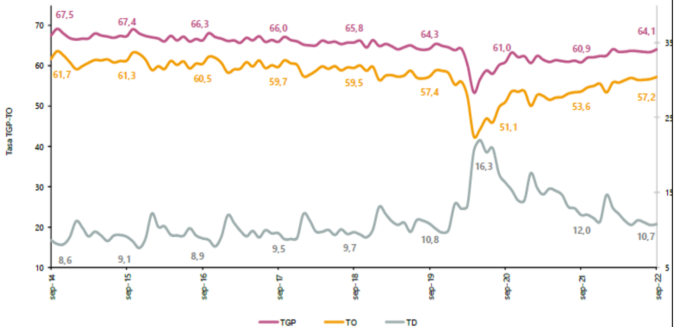
Grafica 2 Tasa global de participación, ocupación y desempleo Total nacional Septiembre (2014 – 2022)

Para el mes de septiembre de 2022, la tasa de desempleo del total nacional fue 10,7%, lo que representó una reducción de 1,2 puntos porcentuales respecto al mismo mes de 2021 (12,0%). La tasa global de participación se ubicó en 64,1%, lo que significó un aumento de 3,2 puntos porcentuales respecto a septiembre de 2021 (60,9%). Finalmente, la tasa de ocupación fue 57,2%, lo que representó un aumento de 3,6 puntos porcentuales respecto al mismo mes de 2021 (53,6%).