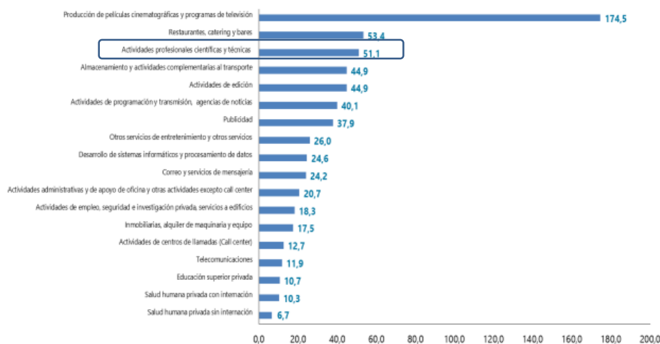
Gráfico 1. Variación anual de los ingresos nominales, según subsector de servicios Total Nacional Mayo 2022 p / mayo 2021