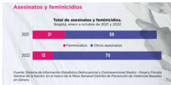
Imagen 5.

Al comparar los periodos comprendidos entre enero y octubre de 2021 y 2022, se evidencia que hubo un incremento en el número de asesinatos de mujeres; sin embargo, hubo una variación en el número de feminicidios tipificados por la Fiscalía General de la Nación de -38% para 2022 (8 casos menos tipificados).