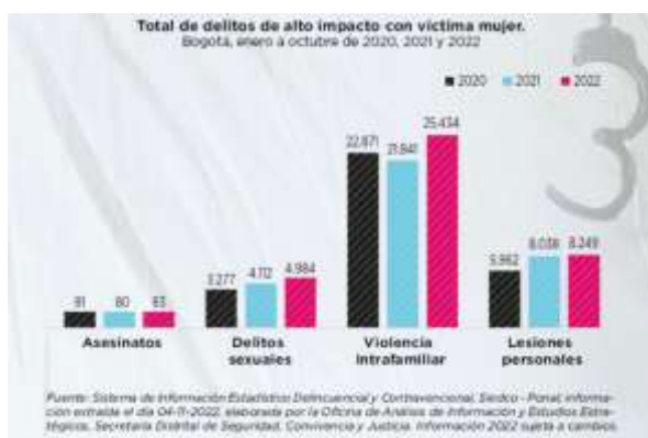
Imagen 1. https://omeg.sdmujer.gov.co/phocadownload/2022/infografias/25N_2022.pdf

De acuerdo con los datos del Observatorio de Mujeres y Equidad de Género (OMEG), entidad que recopila información de diferentes fuentes de información como el Instituto Nacional de Medicina Legal y Ciencias Forenses, el Sistema de Información Estadístico Delincuencial y Contravencional (SIEDCO) de la Policía Nacional y la Fiscalía General de la Nación , respecto a índices de violencia sexual, riesgo de feminicidio y feminicidio en la ciudad durante el año 2021 y 2022, entre otros hechos violentos, se evidencia que el total de delitos de alto impacto contra las mujeres (asesinatos, delitos sexuales, violencia intrafamiliar y lesiones personales) se incrementó el 14% en el periodo de enero a octubre de 2022, en relación con el 2021: los asesinatos a mujeres incrementaron un 4%, con respecto a 2021 (3 casos de diferencia), y del 2 % con respecto al 2020; los delitos sexuales aumentaron un 21% con relación a 2021 y 52% con relación a 2020; la violencia intrafamiliar incrementó 16% con respecto a 2021 y 11% con respecto a 2020; y las lesiones personales crecieron un 3% con respecto a 2021 y 38% en relación a 2020. Todos estos delitos se relacionan con circunstancias asociadas al delito de feminicidio.