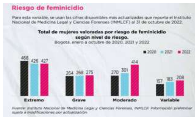
Imagen 6.

Sobre el riesgo de feminicidio, según datos del OMEG para el informe del 25N, desde el 1 de enero de 2020 hasta el 31 de octubre de 2022, el Instituto Nacional de Medicina Legal y Ciencias Forenses ha realizado en total 4,403 valoraciones por riesgo de feminicidio, de las cuales el 58% se han catalogado entre riesgo grave y extremo (2,538). Para el periodo de enero a octubre de 2021 y 2022, el número de valoraciones aumentó un 12%, al pasar de 1,178 en 2021 a 1,324 en 2022. El riesgo moderado fue el que más aportó a este incremento con el 77%. Las valoraciones de riesgo extremo y grave pasaron de representar el 63% en 2020 a representar el 53% en 2022. Adicionalmente, 3 de cada 4 casos involucran mujeres entre 18 y 40 años, mientras 2 de cada 100 de las mujeres valoradas en el periodo de enero a octubre de 2022 declararon ser mayores de 60 años.