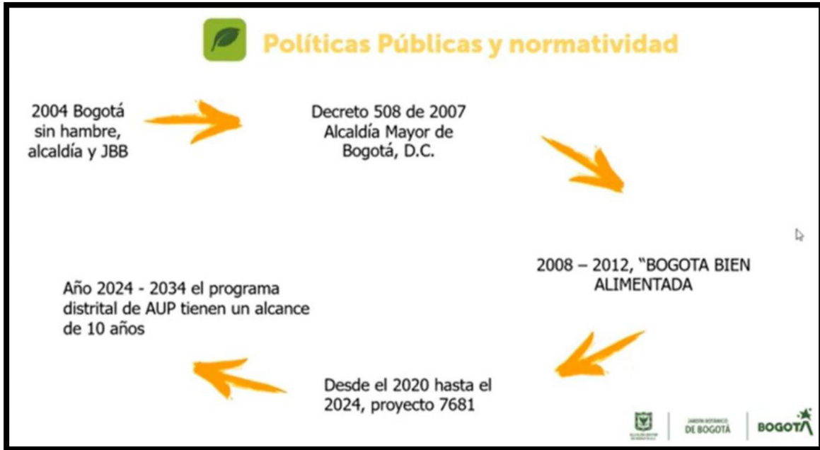
Figura 2. Políticas Públicas y Normatividad de la Agricultura Urbana en Bogotá.