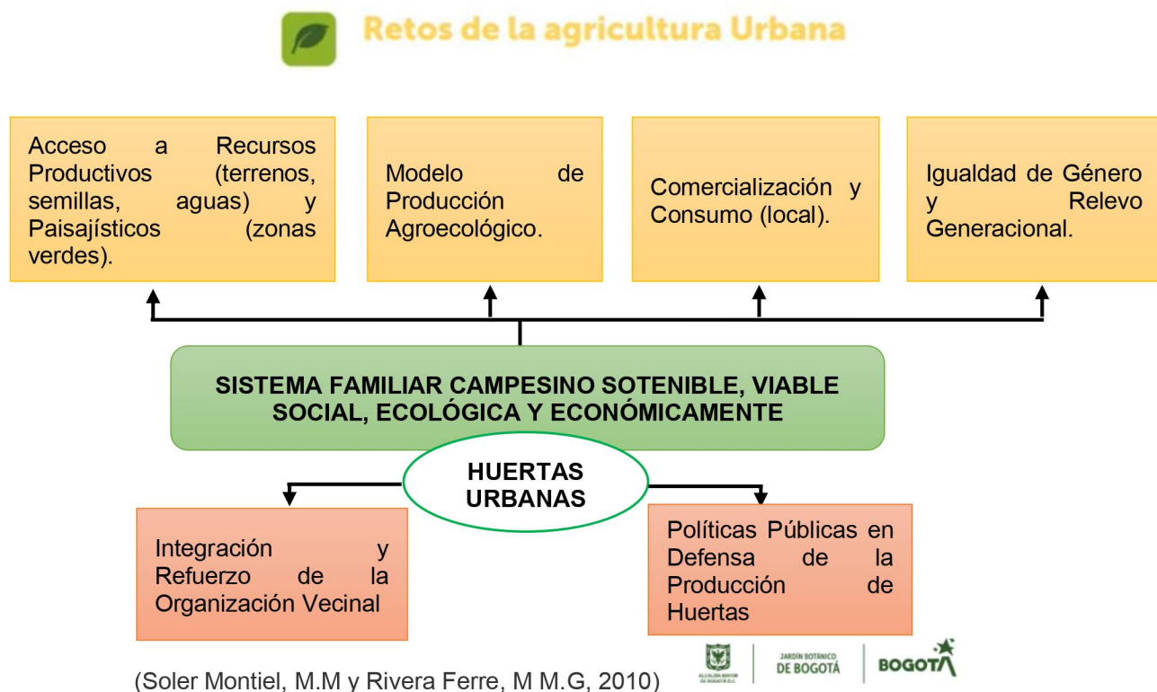
Figura 3. Retos de la Agricultura Urbana