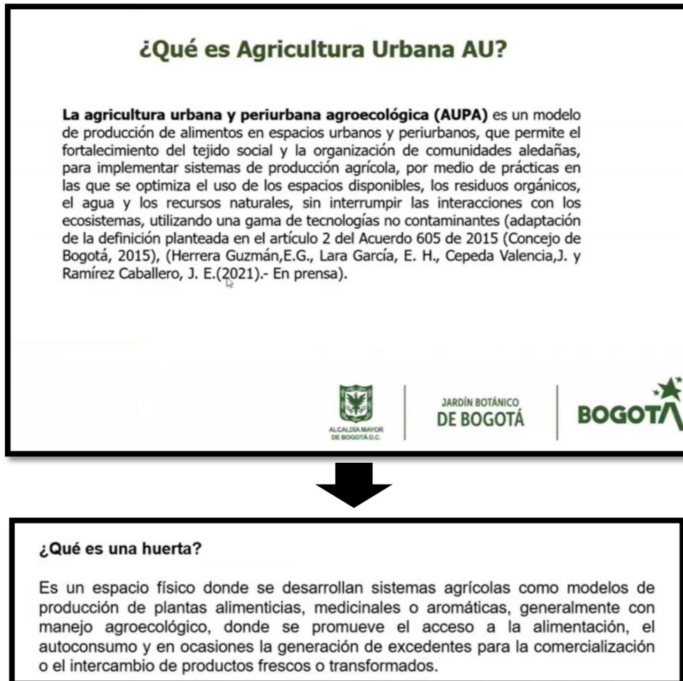
Figura 1. Concepto de Agricultura Urbana y Huerta Urbana