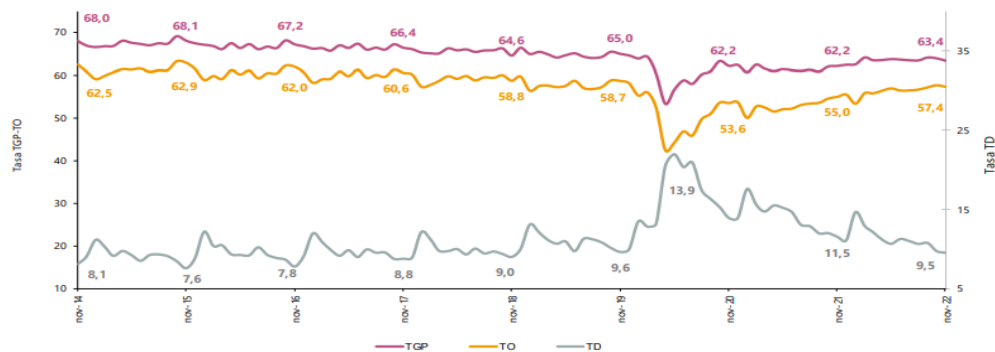
Gráfico 2. Tasa global de participación, ocupación y desempleo Total nacional Noviembre (2014 – 2022)