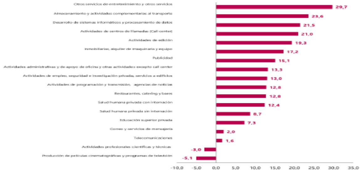
Gráfico 1. Variación anual de los ingresos nominales, según subsector de servicios Total nacional Noviembre 2022 P