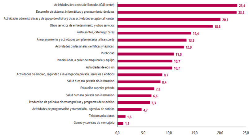
Gráfico 1. Variación anual de los ingresos nominales, según subsector de servicios Total nacional Diciembre 2022 P