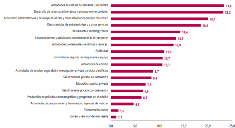
Gráfico 1. Variación anual de los ingresos nominales, según subsector de servicios Total nacional Diciembre 2022 P