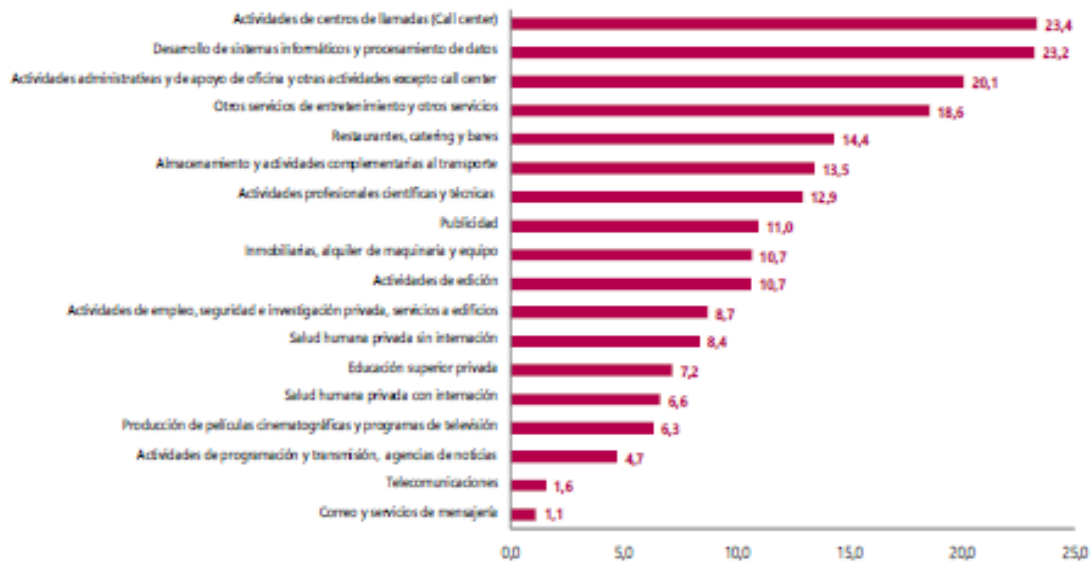
Gráfico 1. Variación anual de los ingresos nominales, según subsector de servicios Total nacional Diciembre 2022*