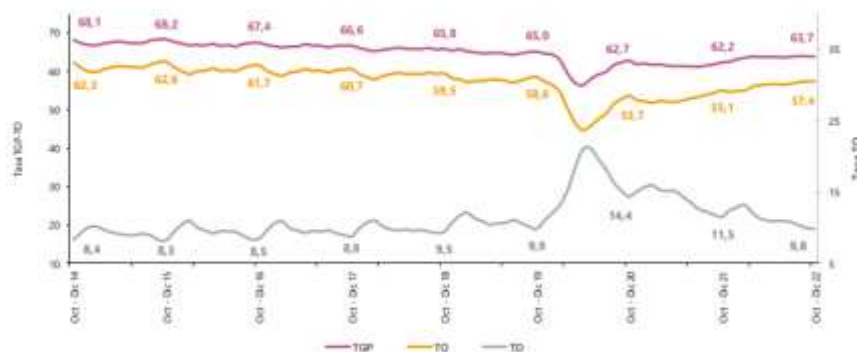
Gráfico 4. Tasa global de participación, ocupación y desempleo Total nacional Octubre - diciembre (2014 - 2022)

En diciembre de 2022, la tasa de desempleo en el total de las 13 ciudades y áreas metropolitanas se ubicó en 10,8%, para diciembre de 2021 fue 11,4%. La tasa global de participación se ubicó en 66,0%, lo que significó un aumento de 3,4 puntos porcentuales respecto a diciembre de 2021 (62,6%). Finalmente, la tasa de ocupación fue 58,8%, lo que representó un aumento de 3,4 puntos porcentuales respecto al mismo mes de 2021 (55,4%).