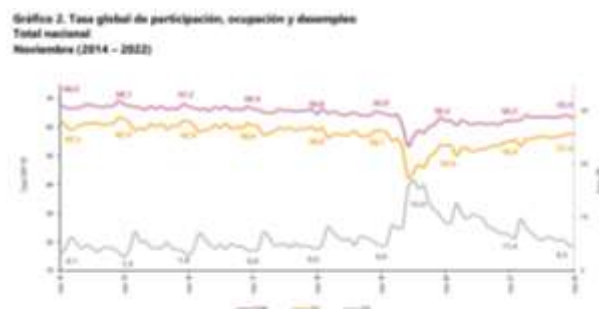
Gráfico. Tasa global de participación, ocupación y desempleo Total nacional Noviembre (2014 – 2022)

Para el mes de noviembre de 2022, la tasa de desempleo del total nacional fue 9,5%, lo que representó una reducción de 2,0 puntos porcentuales respecto al mismo mes de 2021 (11,5%). La tasa global de participación se ubicó en 63,4%, lo que significó un aumento de 1,2 puntos porcentuales respecto a noviembre de 2021 (62,2%). Finalmente, la tasa de ocupación fue 57,4%, lo que representó un aumento de 2,3 puntos porcentuales respecto al mismo mes de 2021 (55,0%).