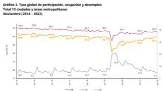
Gráfico. Tasa global de participación, ocupación y desempleo Total 13 ciudades y áreas metropolitanas Noviembre (2014 - 2022)

En noviembre de 2022, la tasa de desempleo en el total de las 13 ciudades y áreas metropolitanas fue 9,1%, lo que representó una reducción de 3,1 puntos porcentuales respecto al mismo mes de 2021 (12,2%). La tasa global de participación se ubicó en 65,5%, lo que significó un aumento de 2,1 puntos porcentuales respecto a noviembre de 2021 (63,4%). Finalmente, la tasa de ocupación fue 59,5%, lo que representó un aumento de 3,9 puntos porcentuales respecto al mismo mes de 2021 (55,6%). 2