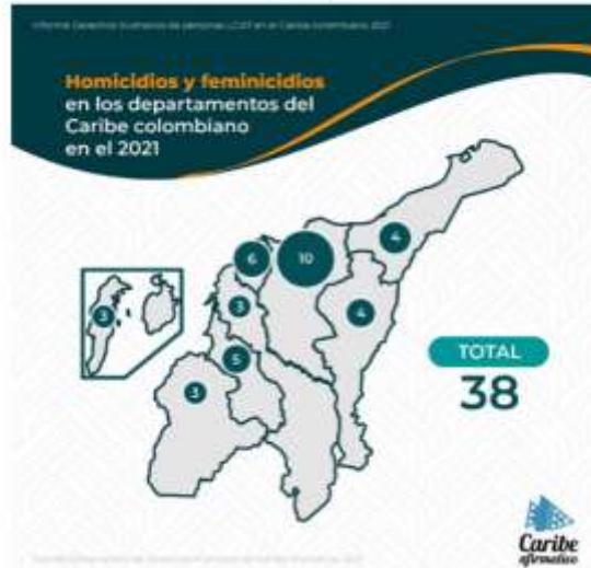
Gráfica No. 1. Homicidios y feminicidios en los departamentos del Caribe colombiano en el 2021

A su vez, las personas con orientaciones sexuales, identidades y expresiones de género diversas han sido víctimas de amenazas, las cuales tienen como propósito hostigar, intimidar, excluir o restringir el goce o disfrute de sus derechos. El Observatorio de Derechos Humanos de Caribe Afirmativo ha recogido los casos ocurridos en el 2021 en la región en donde se presentaron amenazas de carácter individual y colectivo. En primer lugar, encontramos que las amenazas de carácter individual están estrechamente determinadas por el trabajo y/o liderazgo, la visibilidad de su orientación sexual o identidad de género y por la animadversión por parte del victimario hacia la orientación sexual o de género (Caribe Afirmativo, 2021) y las colectivas asociadas a actores armados ilegales. En el 2021 se registraron un total de 8 amenazas individuales y 20 amenazas colectivas, datos que incluyeron a la región Caribe Colombiana al ser allegados al Observatorio por parte de las víctimas.