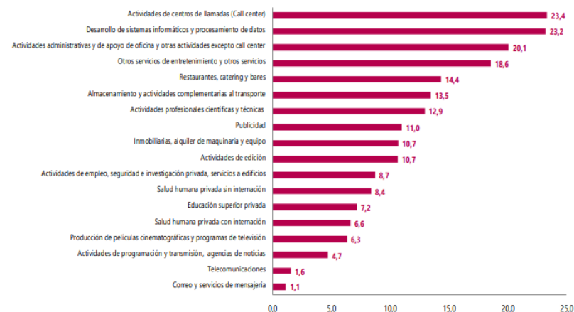
Gráfico 1. Variación anual de los ingresos nominales, según subsector de servicios Total nacional Diciembre 2022 P