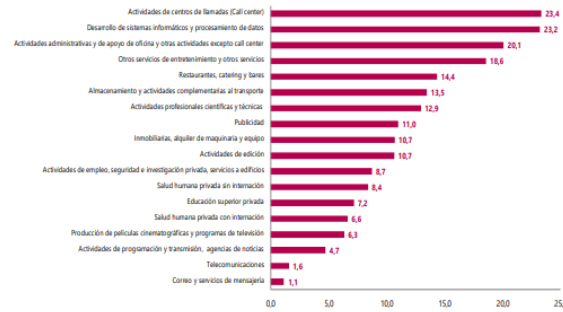
Gráfico 1. Variación anual de los ingresos nominales, según subsector de servicios Total nacional Diciembre 2022 p