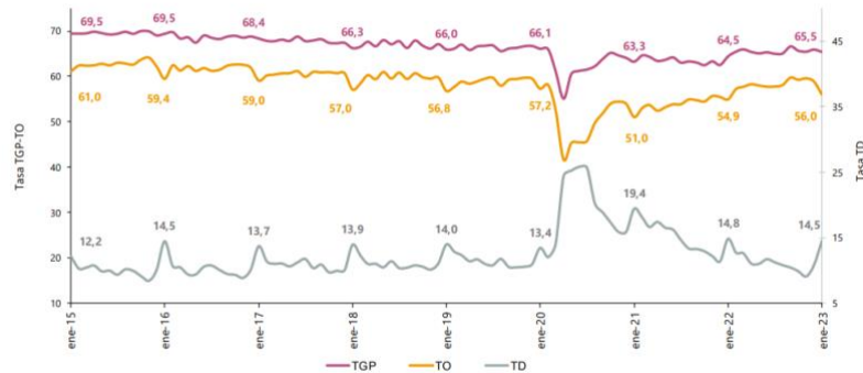
Gráfico 3. Tasa global de participación, ocupación y desempleo Total 13 ciudades y áreas metropolitanas Enero (2015 - 2023)

En enero de 2023, la tasa de desempleo en el total de las 13 ciudades y áreas metropolitanas fue 14,5%, la tasa global de participación 65,5% y la tasa de ocupación 56,0%. En enero de 2022 estas tasas se ubicaron en 14,8%, 64,5% y 54,9%, respectivamente.