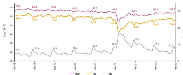
Gráfico 1. Tasa global de participación, ocupación y desempleo Total nacional Febrero (2015 – 2023)