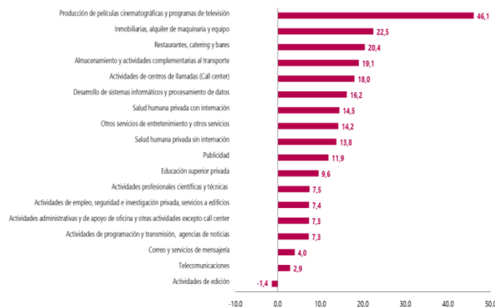
Gráfico 1. Variación anual de los ingresos nominales, según subsector de servicios Total nacional Febrero 2023 P / febrero 2022