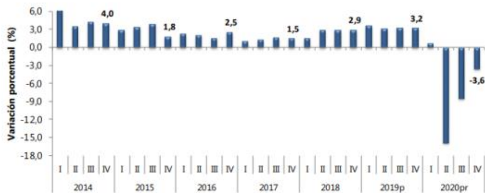
Gráfico 1. Producto Interno Bruto (PIB) Tasas de crecimiento en volumen 1 2014-I-2020 pr -IV