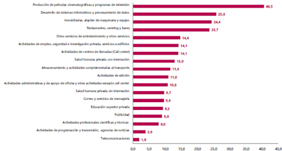
Gráfico 1. Variación anual de los ingresos nominales, según subsector de servicios Total nacional Enero 2023 p