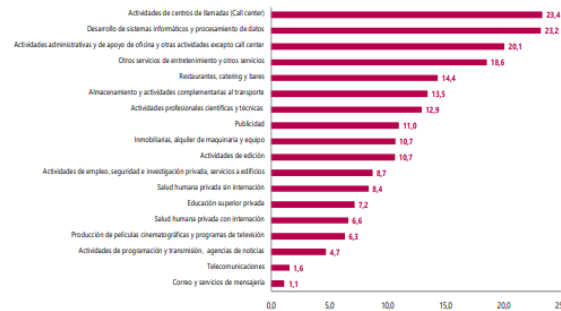
Gráfico 1. Variación anual de los ingresos nominales, según subsector de servicios Total nacional Diciembre 2022 p