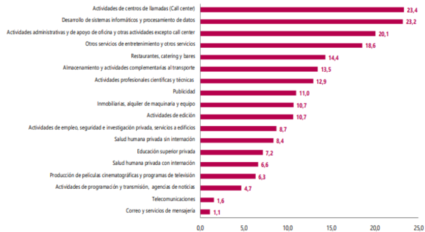
Gráfico 1. Variación anual de los ingresos nominales, según subsector de servicios Total nacional Diciembre 2022 a