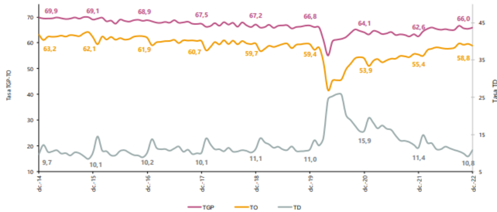
Gráfico 3. Tasa global de participación, ocupación y desempleo Total 13 ciudades y áreas metropolitanas Diciembre (2014 - 2022)

En enero de 2023, la tasa de desempleo en el total de las 13 ciudades y áreas metropolitanas fue 14,5%, la tasa global de participación 65,5% y la tasa de ocupación 56,0%. En enero de 2022 estas tasas se ubicaron en 14,8%, 64,5% y 54,9%, respectivamente.