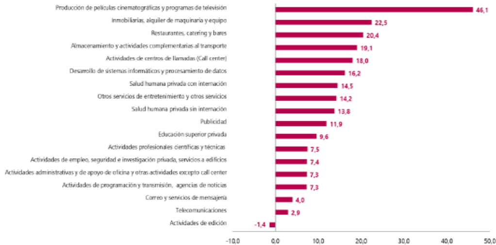
Gráfico 1. Variación anual de los ingresos nominales, según subsector de servicios Total nacional Febrero 2023P / febrero 2022