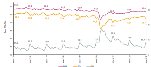
Gráfico 2. Tasa global de participación, ocupación y desempleo Total nacional Enero (2015 - 2023)

Fuente: DANE, GEH. Nota: datos expandidos con proyecciones de población, elaboradas con base en los resultados CNPV 2018. Nota: cifras aproximadas a un decimal. Por efecto del redondeo los totales pueden diferir ligeramente del anexo.